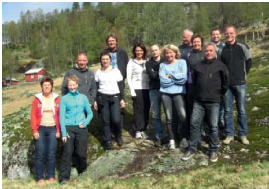
De ansatte på Solholmen overgangsbolig (to var ikke med på bildet)

Søkermassen på de fleste stillingene var stor og med høy kompetanse. Til sammen er det 13 og en halv stilling knyttet til Solholmen overgangsbolig.