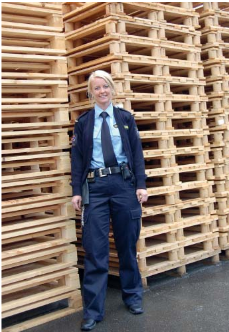
Verdal fengsel er ikke lenger bare pallesteking. Vi har flere typer kompetansegivende kurs og skoletilbud til de innsatte.

Ved nyttår fikk vi en "link" på prosjektet vårt. Husbanken har jobbet i mange år opp mot bostedsløshet og kartlegging av innsatte uten