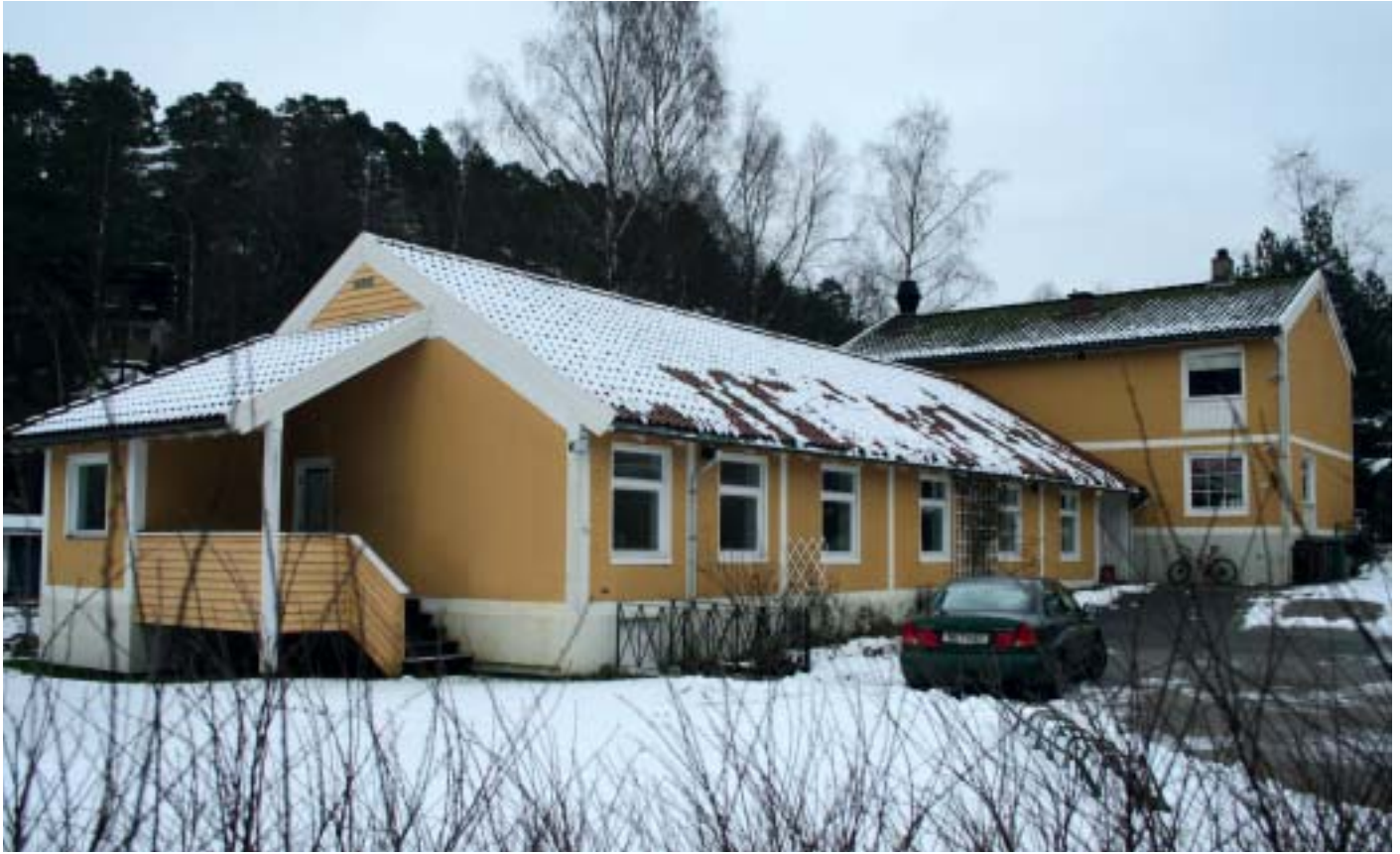
Det gule huset er det opprinnelige, men nå rives det nærmeste for å bygge to etasjer. Dette er planlagt ferdig 15.10.09

Akkurat nå er man i full sving med riving av deler av eksisterende bygningsmasse, for deretter å bygge helt nytt beboerhus i to etasjer for 15 innsatte. Hver enkelt innsatt vil få eget rom, utstyrt som en hybel, med eget bad, kjøkkenavdeling og stue/soverom. Her skal de kunne leve sitt liv så tett opp til "normalen" som mulig, med ansvar for matlaging, vasking klesvask osv. Noen innsatte har egen inntekt som de disponerer selv, mens andre får en dagytelse fra fengselet som gjør dem i stand til å dekke de utgiftene de har til vanlig livsopphold. Beboerfløyen er planlagt ferdig