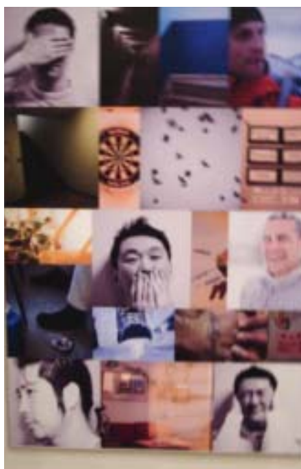
Fra utstillingen, foto: Nora Hallén, KSF

På utstillingen viste 12 innsatte sine fotografier, hvordan de ser det, som et selvportrettsprosjekt. Etter utstilling i fengselet ble hele utstillingen flyttet til Ullensaker Kulturhus på Jessheim som en del av Ullensaker Kulturuke. Utstillingen viste at det finnes mange kreative