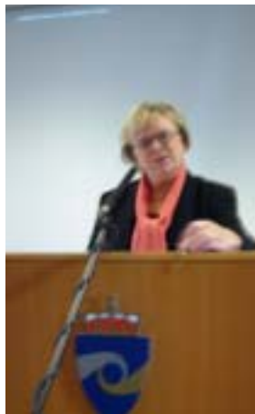
Statsråd Magnhild Meltvedt Kleppa, Kommunal- og regionaldepartementet (KRD).

Statsråd Magnhild Meltvedt Kleppa fortalte på fagkonferansen Faget i Fokus at i uke 46 i 2008 var det 6 100 bostedsløse og at 8 % av disse var innen kriminalomsorgen. Hun var klar på at det i tillegg var mørketall. – Flere innsatte skal få tilbud om egen bolig, sa hun og fremhevet at 2009 skal være et boligsosialt år. – Det bevilges betydelige midler og det arbeides med praktiske ordninger for at midlene skal bli brukt, sa hun. Hun utfordret kriminalomsorgen til å se på om det noen steder er noe som kan forbedres i samarbeidet med kommunene. – Vi avhengig av nært samarbeid med kriminalomsorgen. Bolig er bare en av utfordringene den som løslates står overfor. Det å ha bolig er et sentralt utgangspunkt for kunne organisere livet sitt og en viktig forutsetning for å kunne fungere i samfunnet. Slik sett er bolig kriminalitetsforebyggende, sa hun.