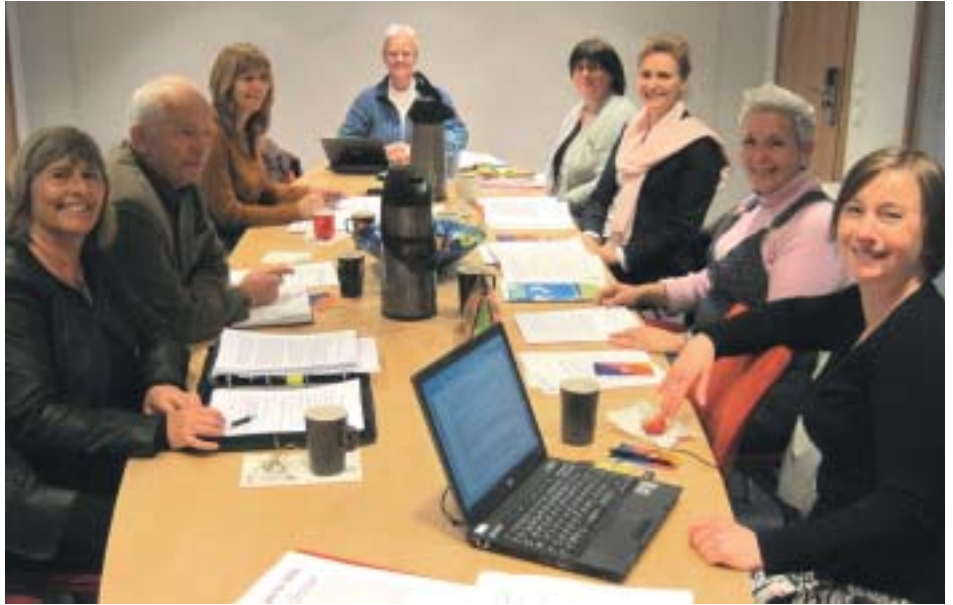
SAK er styringsgruppe for implementeringsprosjektet.

KITT. Styringsgruppe for implementeringsprosjektet er Det sentrale arbeidsmiljøutvalget for kriminalomsorgen.