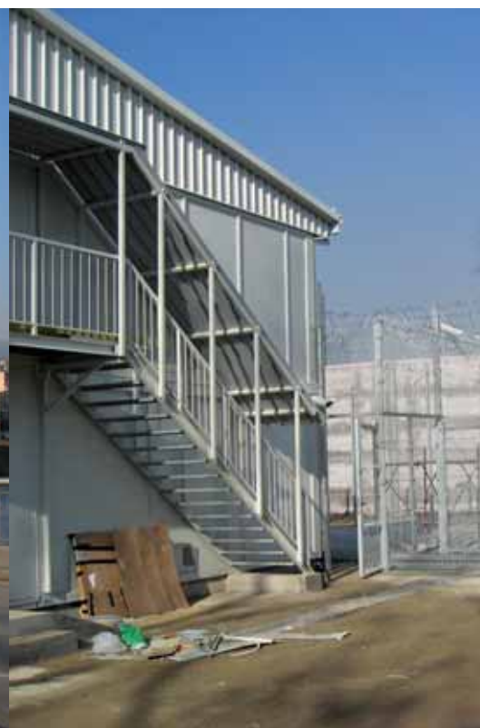
Glimt fra fengselet