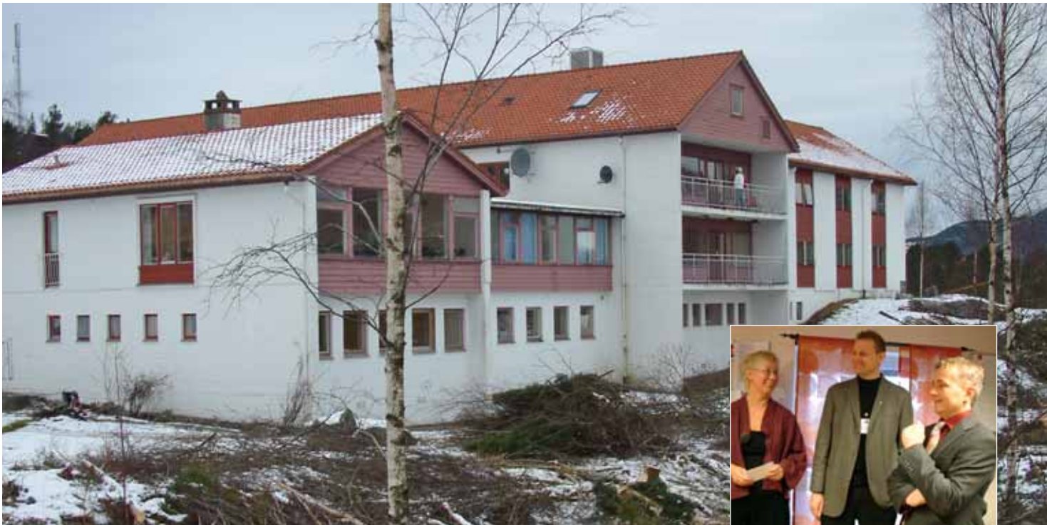
Bjørgvin fengsel holder til i noen av bygningene til Vestlandsheimen. Bak det noe trauste ytre finner vi at her er det ansatt både en filosof og en kunstmaler i full stilling som en del av en kompetent og innsattsvil- lig personalgruppe. Arealet rundt Bjørgvin fengsel ryddes før gjerdet kan settes opp.