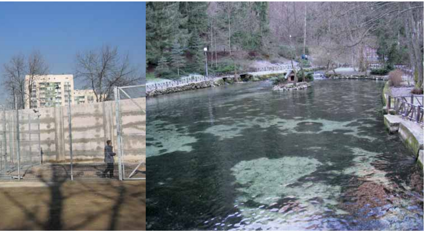
Vanskelig å velge blant mange bilder fra et kontrastfylt land