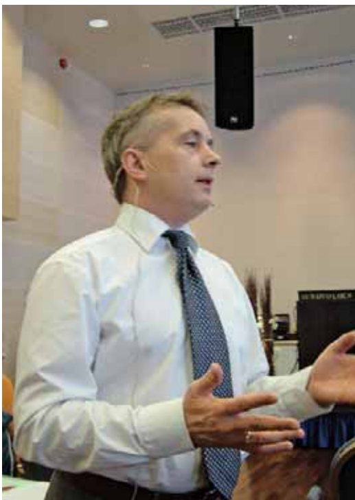
Justisminister Knut Storberget

Hun var også opptatt av hvordan ny teknologi skal kunne frigi årsverk til aktiv kriminalomsorg – blant annet å øke den menneskelige kontakten mellom ansatte og innsatte. Hun tok opp temaer som NEK, LUP,