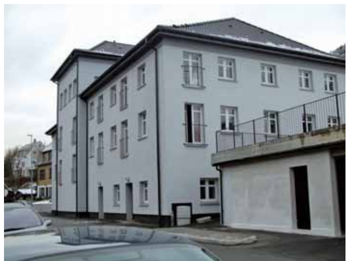
Lyderhorn overgangsbolig har vendepunkt gjennom målrettet samarbeid som motto.