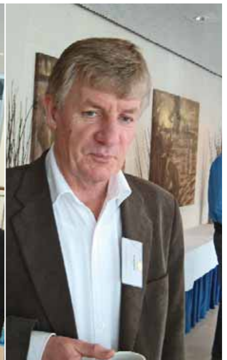
Forbundsleder Geir Bjørkli, NFF